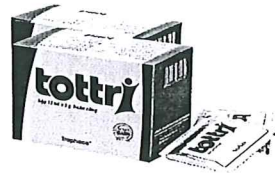
Tottri (Điều trị bệnh trĩ)