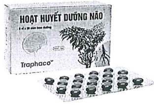
Hoạt huyết dưỡng não