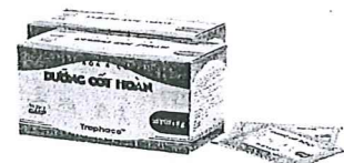
Dưỡng cốt hoàn