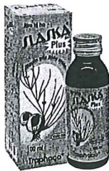
Slaska Plus (Siro trị ho)