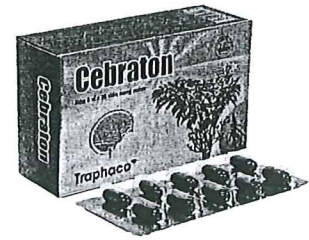
Cebatron (bổ não)