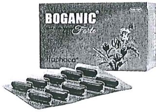
Boganic (Bổ gan)