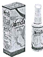
Jamda (Côn xoa bóp)