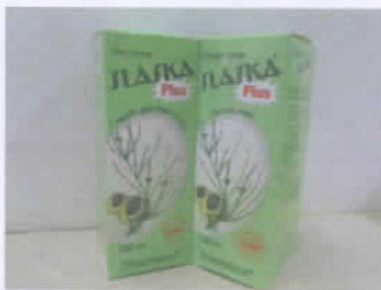
Slaska Plus (Siro trị ho)