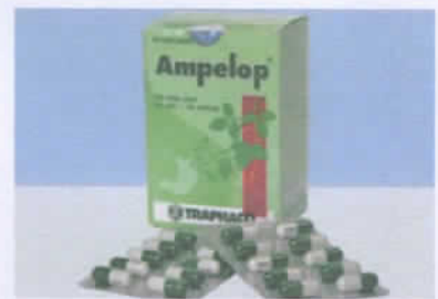
Ampelop (Trị viêm loét dạ dày)