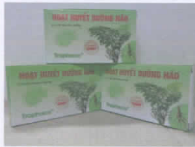
Hoạt huyết dưỡng não