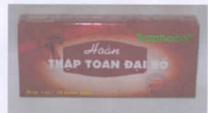
Hoàn Thập toàn đại bổ