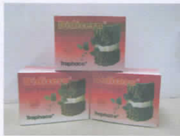
Didicera (Trị đau nhức xương)