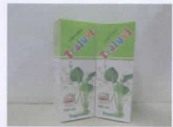
Traluvi (Trị mỡ hôi trộm)