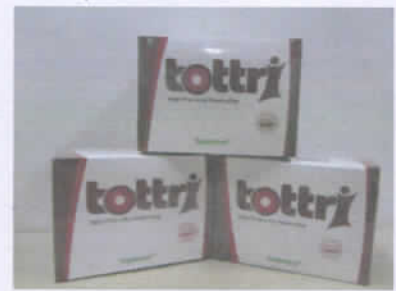
Tottri (Điều trị bệnh trĩ)