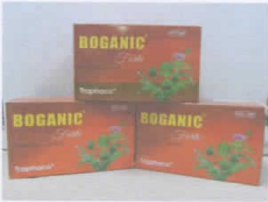
Boganic (Bổ gan)