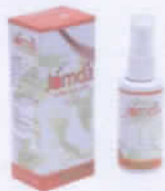
Jamda (Cồn xoa bóp)